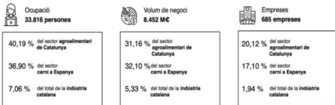
El sector agroalimentari a Catalunya. Prodeca, gener de 2020

Durant el 2020, el nostre sector carni va registrar unes exportacions de 4.592 milions d'euros, un 13,90% més que el 2019 en valor, i un 11,68% més en volum, assolint el total de 1.851.339,13 tones, segons dades de PRODECA i que mostren el gran prestigi internacional de la nostra indústria càrnia, aportant un saldo positiu a la balança comercial catalana de més del 1800%.