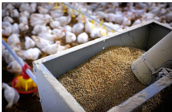
Figura 2. Barreja de pellets i grans sencers