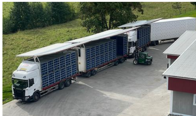
Carga de los pollos en el transporte en una granja sueca.