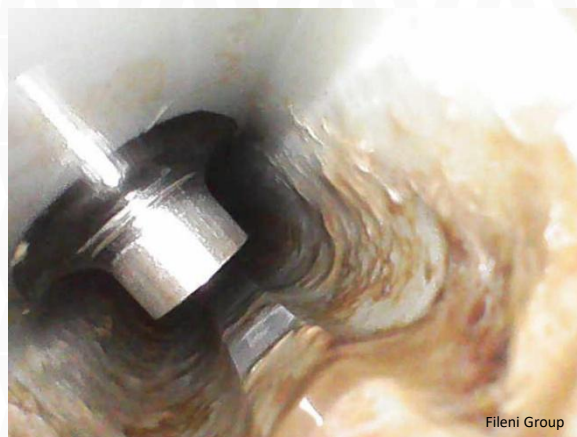
Fig. 1: A dalt, línia d'aigua en condicions normals, sense tractament específic: biopel·lícula i calç evidents (Grup Fileni).

Un manteniment i una neteja adequats i regulars de les línies d'aigua constitueixen una eina eficaç contra la proliferació bacteriana i ajuden a reduir la incidència de Salmonella spp. Aquesta bona pràctica aborda el repte de reduir el risc de salmonel·la, relacionat amb la salut animal.