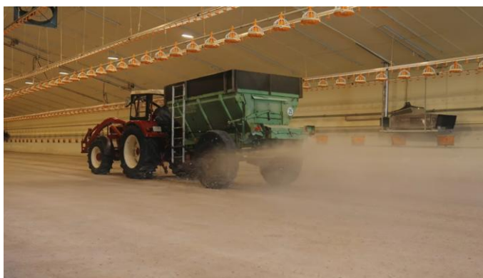
Fig. 3: Aplicació d'ImproBed mitjançant una màquina escampadora de jaç