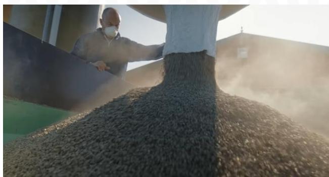
Fig. 2: ImproBed en big bags

La dosi d'aplicació recomanada és de 1,5 kg per m 2 . El subministrament es realitza en contenidors flexibles (Fig. 2).