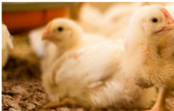
Fig. 4: Pollastres en un jaç ImproBed amb estructura de pèl·let

Més Informació en el Vídeo: https://www.youtube.com/watch?v=UmBy-jb0PCQ